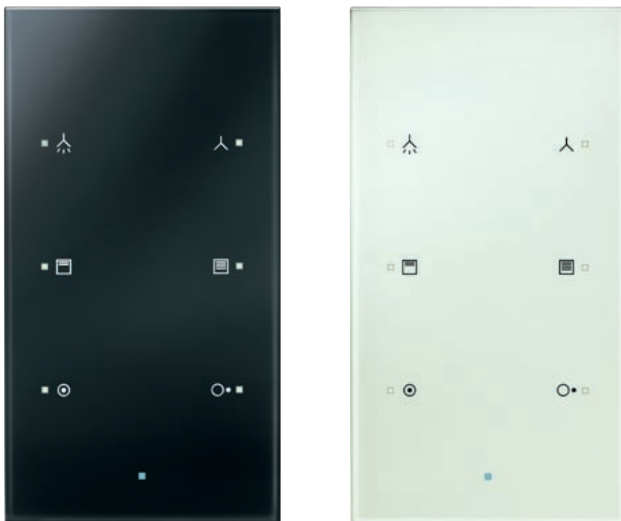
Berker TS Sensor in Schwarz und Polarweiß mit Symbolik, rechts in Alu in Originalgröße 86 x 160 mm

Die gewünschten Schrift- und Symbol-Elemente werden immer über den Berker Online-Konfigurator zusammengestellt. Dabei legen Sie für jede Sensorfläche die zugehörige Beschriftung und Symbolik fest und wählen die jeweilige Bezeichnung aus. Bestellt wird – wie gewohnt – über den Großhandel. Mehr dazu erfahren Sie unter www.berker.de/ts-sensor . Bei noch individuelleren Wünschen für die Gestaltung oder Beschriftung des Berker TS Sensor bietet die Berker Manufaktur die passenden Lösungen.