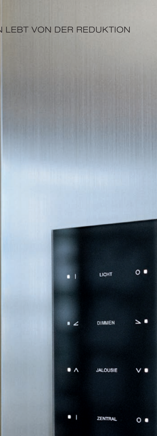
Berker TS Sensor, Customized, in Schwarz